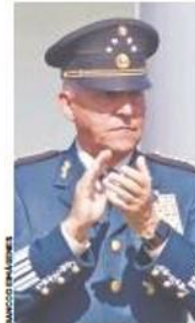
• General Salvador Cienfuegos, ex secretario de la Defensa Nacional.

• A menos de dos meses de que EU retiró los cargos en contra de “El Padrino”, como lo tenía identificado la DEA, la Fiscalía mexicana determinó que no hay delitos que perseguir contra el divisionario en territorio nacional. 18